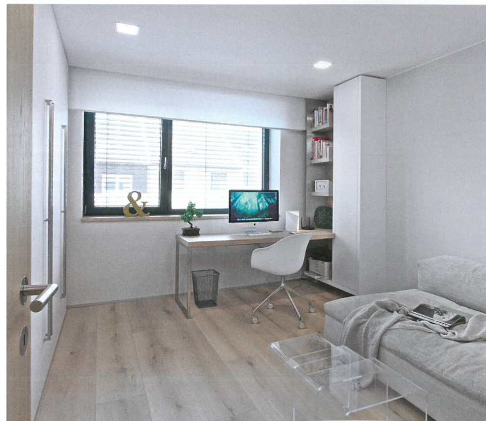
◀ V pracovně, která se později nejspíš promění v dětský pokoj, našly uplatnění pohovka a hnízdový stůl, které zůstaly z původního vybavení domu