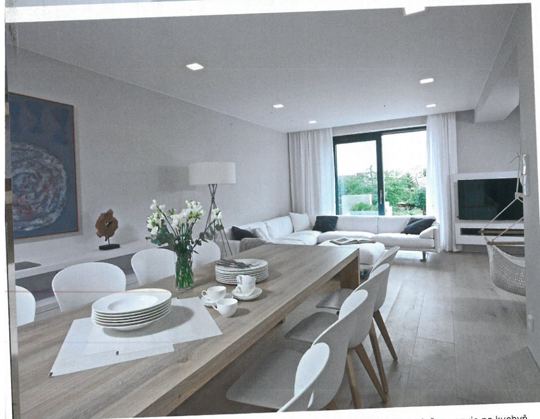
▲ Jídelna volně navazuje na kuchyň a svým vybavením podporuje užší a protáhlý tvar prostoru

Poměrně úzký řadový dům s výměrou zhruba 250 m 2 , se třemi nadzemními podlažními a sníženým sklepem s garáží, postavený na přelomu 70. a 80. let minulého století, nedokázal mladé rodině zcela vyhovět. Pro jeho optimální využití nestačily jen „kosmetické“ úpravy, bylo třeba zasáhnout poněkud radikálněji a lépe se vypořádat nejen s dispozičním členěním interiéru. Ivan i Nora byli na místní lokalitu a její krásné prostředí fixováni, proto se rozhodli v domě, v němž už delší dobu žili, pro jeho kompletní rekonstrukci. Při respektování nosných stěn byla dispozice celého domu vytvořena nově. Ubylo příček, okna se zvětšila, snížila a odstranily se i parapety. Nové otvory pro dveře byly sjednoceny tak, aby byl prostor opticky vyšší. Velký důraz byl kladen na maximální prosvětlení interiéru a jednoduché linie. Podzemní podlaží Ivan využívá ke svému byznysu, dvě patra pak obývá mladá rodina a podkroví je určeno hostům. Tam je komfortní byt s ložnicí, pracovnou, koupelnou a polyfunkčním prostorem. Zpravidla je využíván návštěvami příbuzných žijících v zahraničí. Výhledově ale může posloužit i některému z dětí.