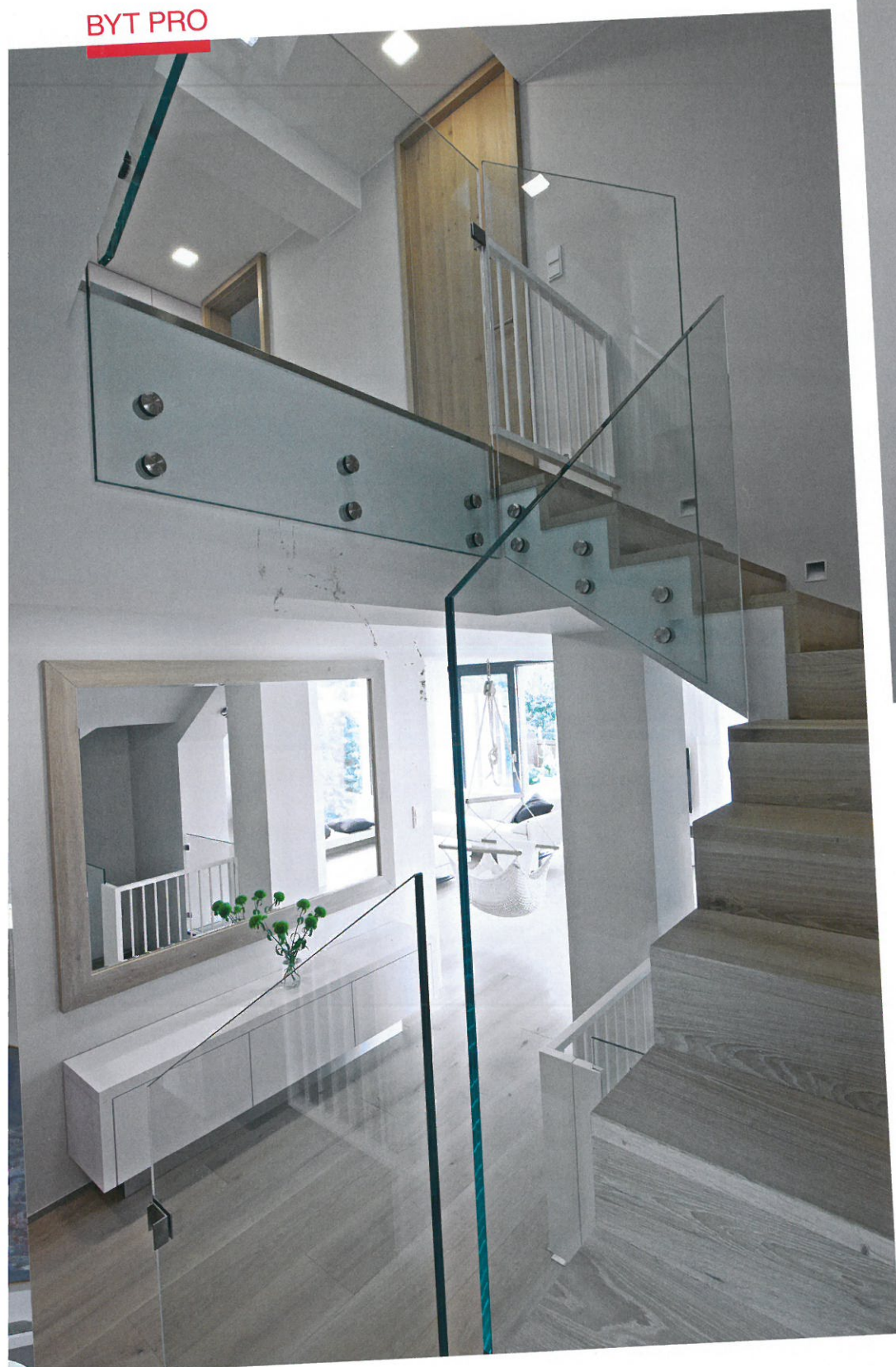
▲ Schodiště změnilo svůj vzhled. Bylo nově obloženo dubovým dřevem a původní zděné zábradlí nahradilo čiré sklo. Ani chodbu neminul nábytek zhotovený na míru. Místo pomáhá prosvětlit velké zrcadlo v dubovém rámu

dikálně však změnilo svůj vzhled. Byly odstraněny nerovnosti a eliminovány rozdílné výšky schodišťových stupňů, které byly nově obloženy dubovým dřevem, a původní zděné zábradlí nahradilo čiré sklo. Při vstupu do domu, po pravé straně chodby, se nachází praktická šatna s policovými systémy, která sousedí s WC místností. Prosklený průhled do kuchyně na protější stěně sem přivádí denní světlo. Pro větší pohodlí při obouvání je zde také možné usednout na bílou koženou lavici. Přízemí