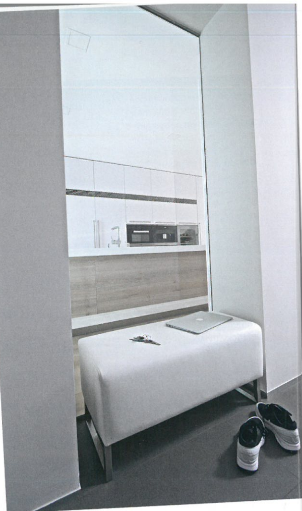
▲ Prosklený průhled do kuchyně přivádí do chodby denní světlo

dikálně však změnilo svůj vzhled. Byly odstraněny nerovnosti a eliminovány rozdílné výšky schodišťových stupňů, které byly nově obloženy dubovým dřevem, a původní zděné zábradlí nahradilo čiré sklo. Při vstupu do domu, po pravé straně chodby, se nachází praktická šatna s policovými systémy, která sousedí s WC místností. Prosklený průhled do kuchyně na protější stěně sem přivádí denní světlo. Pro větší pohodlí při obouvání je zde také možné usednout na bílou koženou lavici. Přízemí