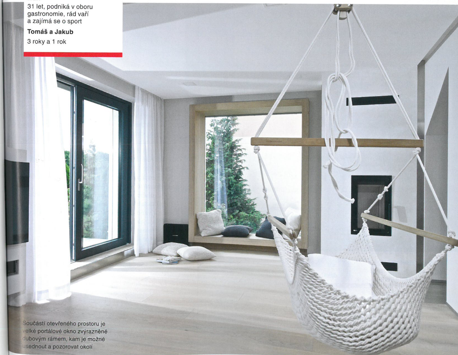
Součástí otevřeného prostoru je velké portálové okno zvýrazněné dubovým rámem, kam je možné usednout a pozorovat okolí