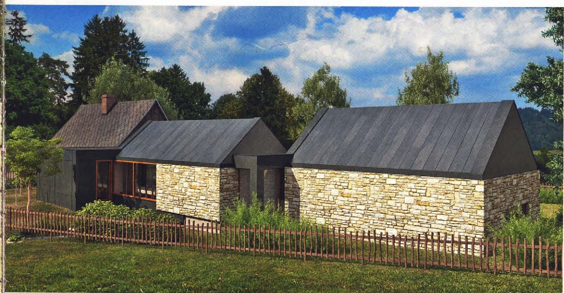
Pohled ze severovýchodu. Kamenné obezdívky a sedlové střechy připomínají tradiční archetyp stodoly