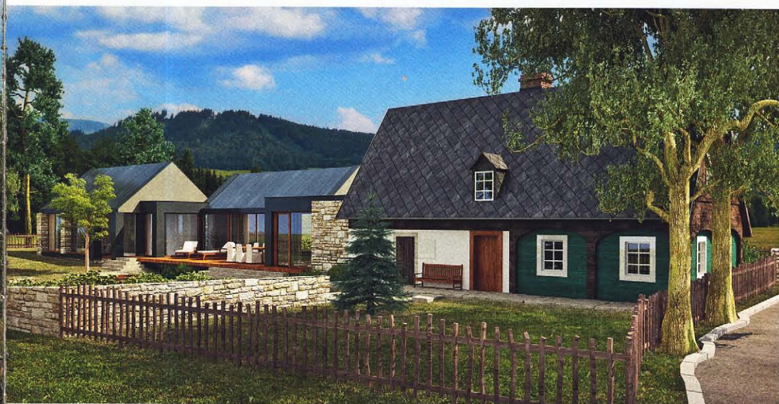
Původní chalupa přímo sousedí se silnicí, přístavba v zadní části pozemku nabízí více soukromí