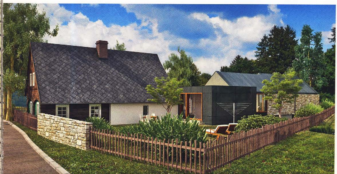
Ve východním rohu parcely vzniklo zákoutí pro klidnou snídani prozářenou ranním sluníčkem